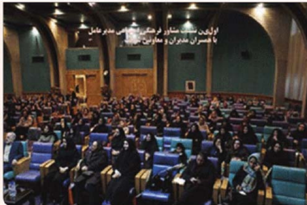
اولین نشست مشاور فرهنگی ذوب آهن اصفهان با همسران مدیران و معاونین

وی با اشاره به اینکه برای دستیابی به اهداف فرهنگی ذکر شده در شرکت، مجموعه دوره‌های آموزشی نیز در نظر گرفته شده است. گفت: در این راستا باید به کلاس‌های خودشناسی اشاره کرد که در قالب ۹۰ جلسه یک‌ساعته در راستای شناخت انسان و با توجه به تأکیدات مقام معظم رهبری درباره بیماری اسلامی برگزار می‌شود. دوره‌های خودشناسی ویژه شاغلان با حضور بیش از ۷۰ نفر در سالن دانش مدیریت آموزش و توسعه منابع انسانی و سالن تشریفات روابط عمومی از ۲۴ آذرماه آغاز و تاکنون ۵ جلسه برگزار شده است. همچنین دوره‌های خودشناسی ویژه همسران شاغلان نیز در بیمارستان شهید مطهری در حال برگزاری است.